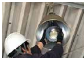
③ハイベイライト取付